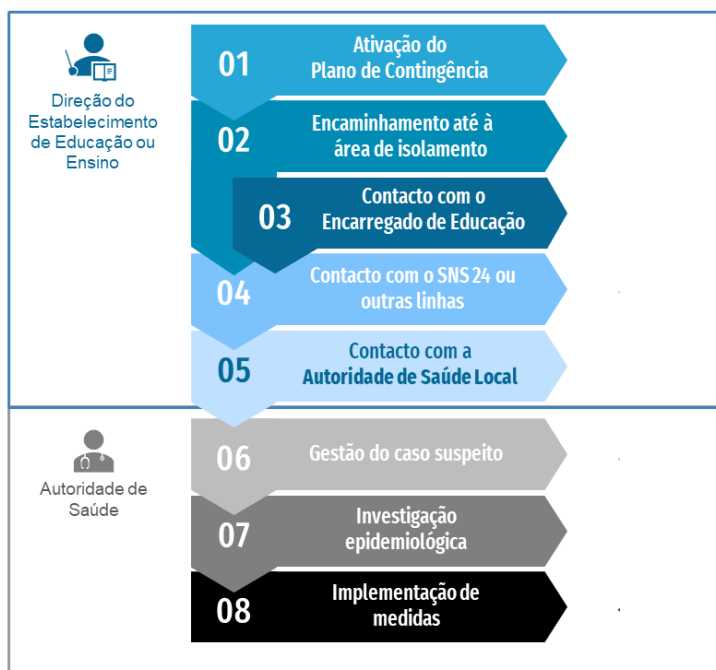
Figura 1. Fluxograma de atuação perante um caso possível ou provável de COVID-19 em contexto escolar