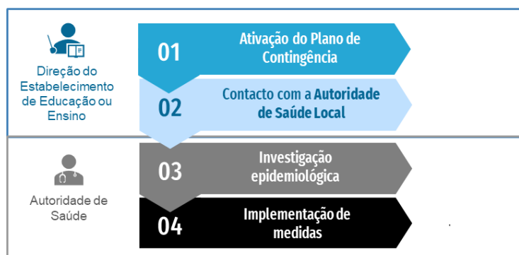
Figura 2. Fluxograma de atuação perante um caso confirmado de COVID-19 em contexto escolar

Perante a comunicação ao estabelecimento de educação e/ou ensino, de um caso confirmado de COVID-19 de uma pessoa que tenha frequentado o estabelecimento, devem ser imediatamente ativados todos os procedimentos constantes no Plano de Contingência e contactado o ponto focal da Escola